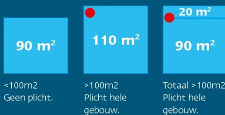
Kantoorgebouw met nevenfunctie bijvoorbeeld bedrijfsrestaurant