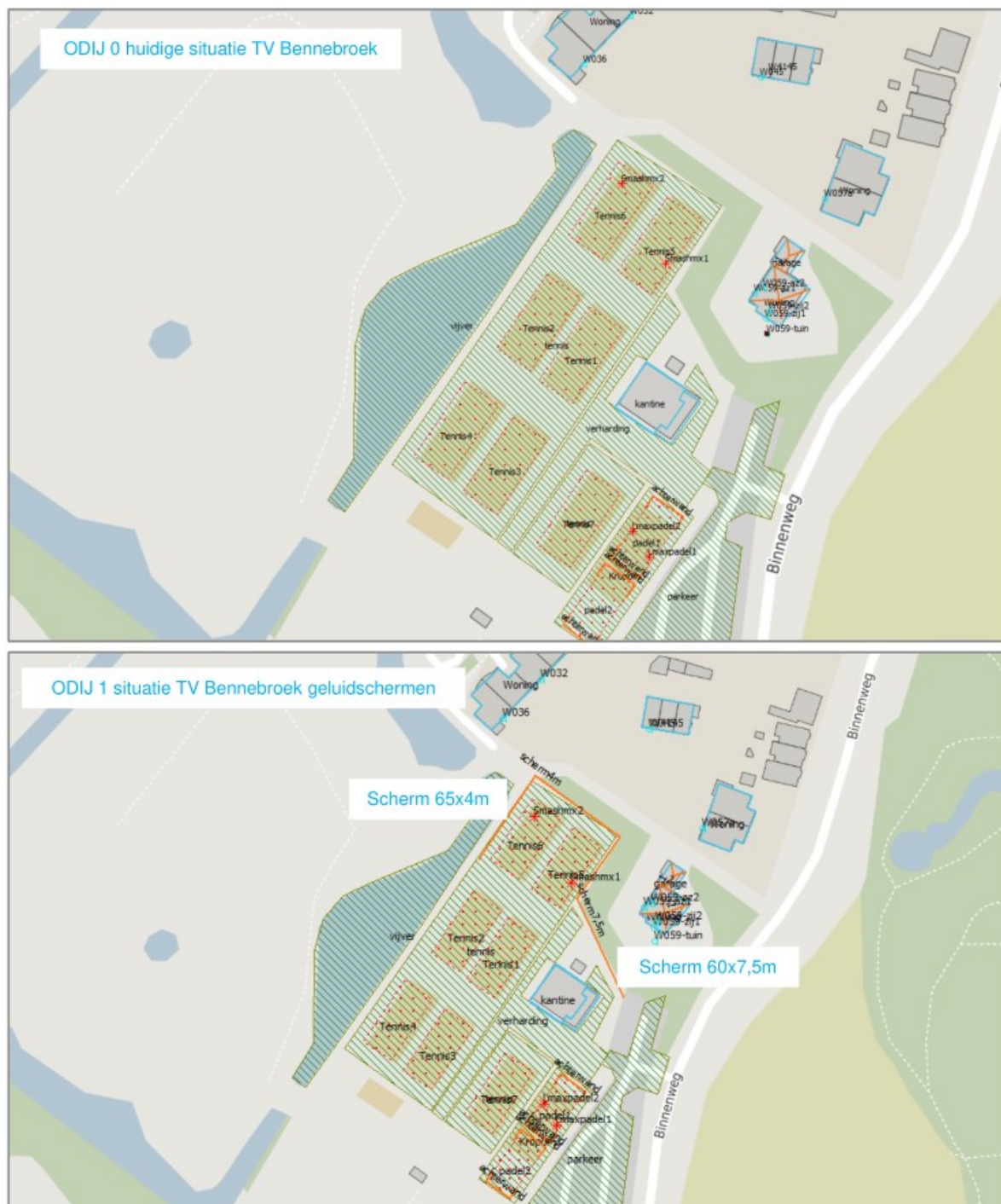
Figuur 3.1 Figuren rekenmodellen ODIJ 0 en ODIJ 1 (en schermen in oranje)