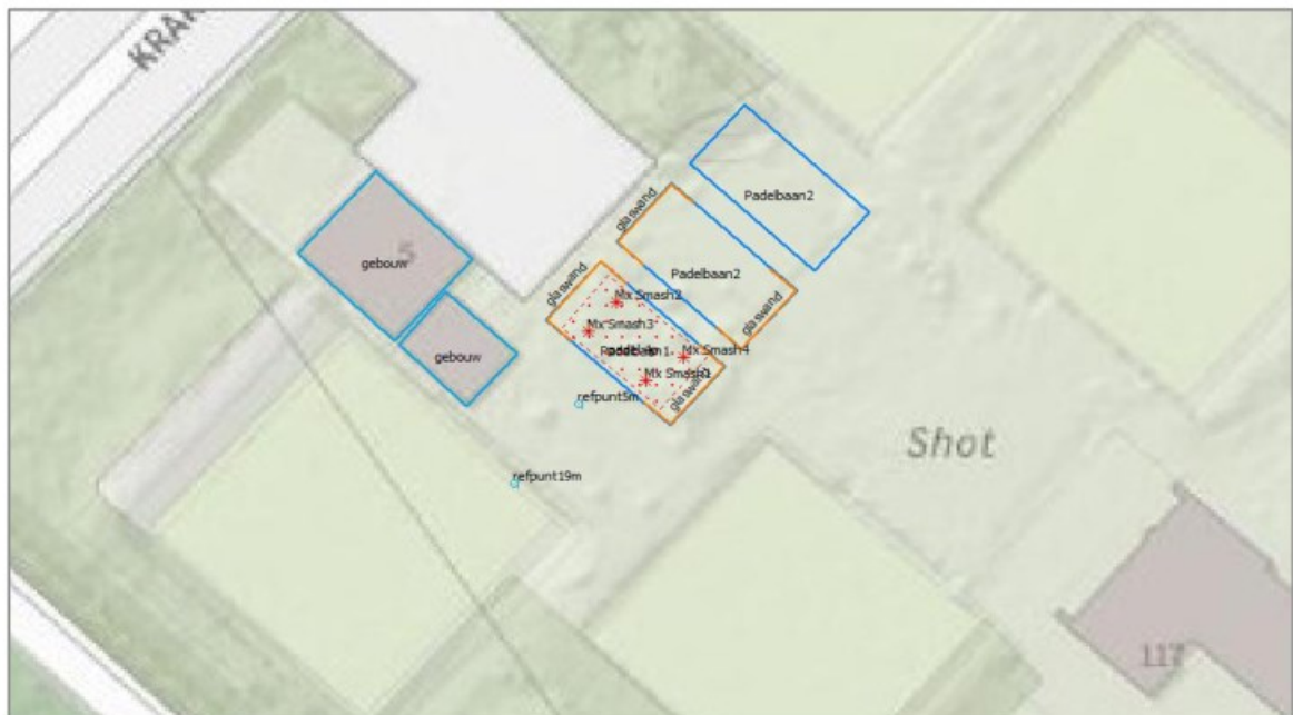
Figuur 3.1 Meetposities 15 april Shot Zeist

Hierbij is een akoestisch rekenmodel gedimensioneerd op basis van de uitgevoerde geluidmetingen op 2 posities vanaf de open zijde van de padelbaan. Zo is nauwelijks invloed van de afschermdende glaswanden aan de achterzijde van de padelbanen (behoudens wat geluidreflectie in de padelkooi). Er stond een geluidmeter op 5 meter afstand van de zijkant van de baan (10 meter uit het hart van de baan) en een geluidmeter op 19 meter vanaf de zijkant van de baan (24 meter uit het hart van de baan, in dezelfde richting). In onderstaande figuur zijn de meetposities (refpunt 5m en refpunt 19m) weergegeven.