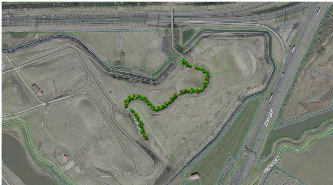
Figuur 1 Ligging toekomstige ecobos

Het Klaas Groot Pad wordt goed herkenbaar in het park.